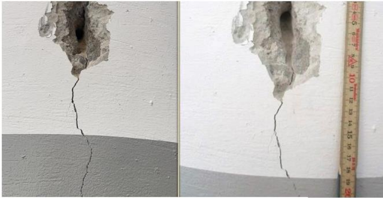
Figur 5, bild till vänster är från 2024 och bild till höger från 2016.

Stompelare för taket har vertikala sprickor längs med pelarnas längd: