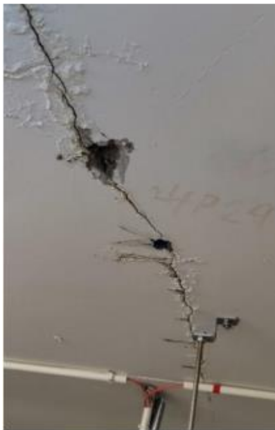
Provtagning 24P29. Provtagning mitt i krympspricka för ramp. Källa: Skadeutredning garage WSP 2024-09-10