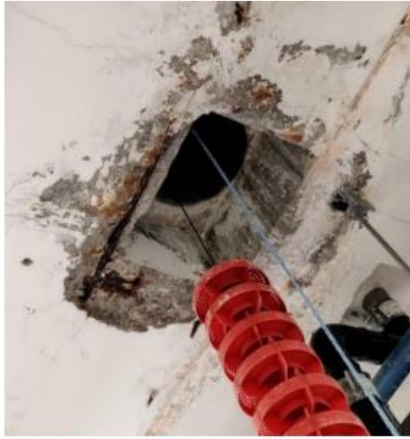
Figur 3, spjälkad och blottad armering vid genomföring för lindrag. Källa: Skadeutredning tävlingsbassängen (25m) WSP 2024-09-06